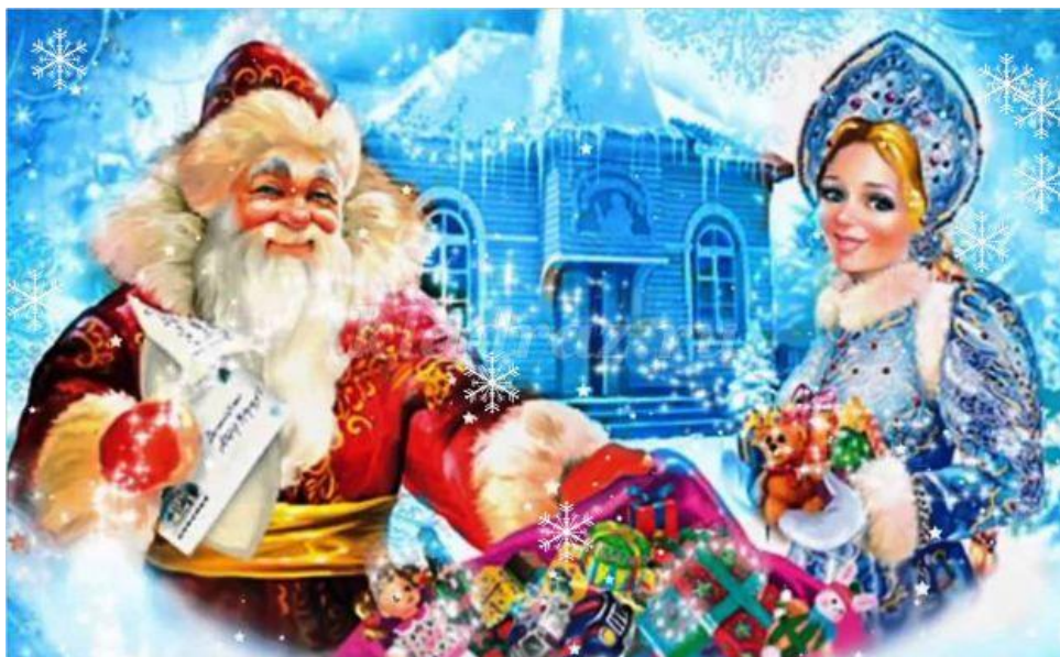
«Коллеги» Деда Мороза

На Руси верили, что как Новый год встретишь, так его и проведешь. Поэтому на Новый год нельзя заниматься тяжелой работой. Зато нужно украшать свой дом, накрывать изобильный стол, одевать все самое новое и красивое и, конечно, дарить подарки!