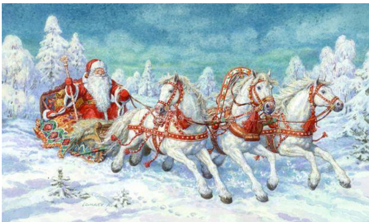
Дед Мороз — это добрый дедушка, который приезжает из далекого края. Он везет с собой огромные мешки подарков для детей, которые он заготавливает целый год.