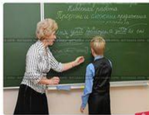
Учитель и ученик у доски.