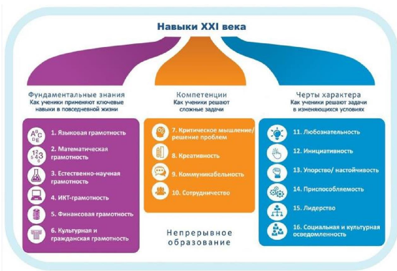
Рисунок 1. Образовательная модель World Economic Forum

Фундаментальные (базовые) знания показывают, как обучающиеся применяют основные навыки для решения повседневных задач. Эти навыки служат основой, на которой впоследствии будут строиться более продвинутые и не менее важные компетенции и качества характера. В эту категорию входят не только оцениваемые на глобальном уровне навыки грамотности и счета, но и способность человека осознавать и применять научные знания, грамотность в области ИКТ, финансовая, а также культурная и гражданская грамотности.