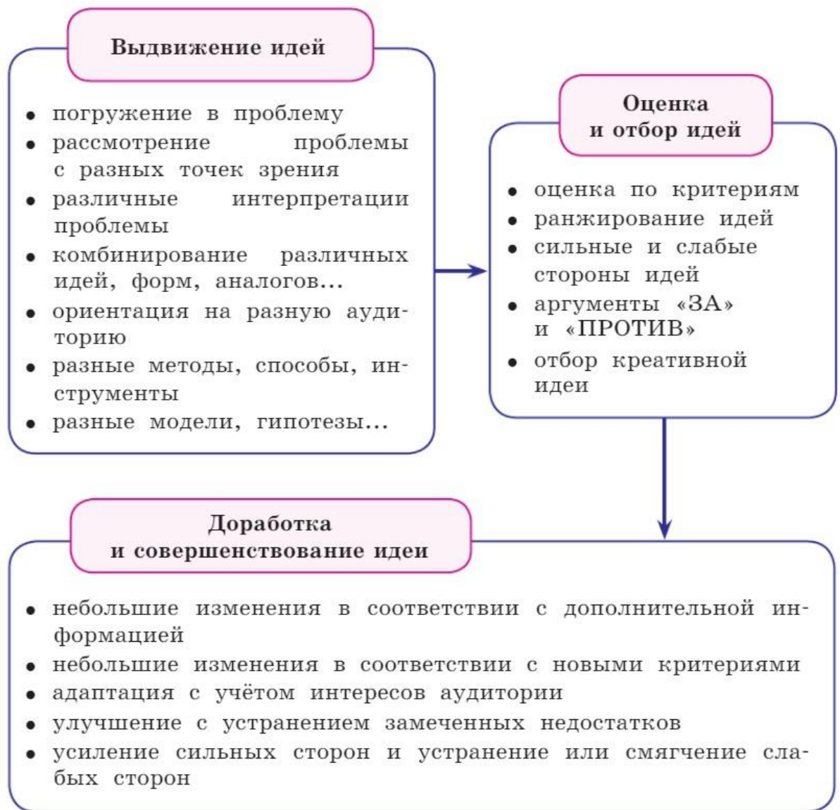
Рисунок 2. Действия, требуемые при выполнении заданий на креативность

При оценивании заданий учитывается, что креативная идея (решение) – это всегда идея: